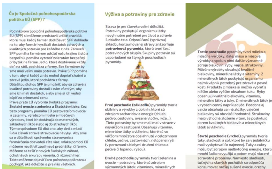
Obrázok 2: Informačná brožúra pre základné školy

programov pre ovocie a zeleninu a mlieko a mliečne výrobky. Detailnejšie tiež prostredníctvom 6 potravinových skupín popisuje princíp potravinovej pyramídy.