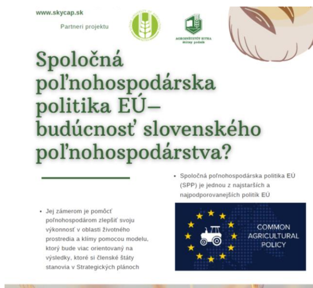
Obrázok 3: Propagačný leták pre stredné školy