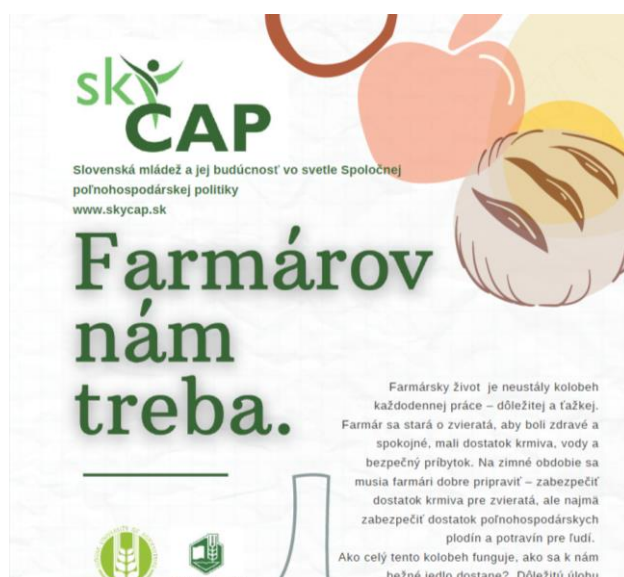
Obrázok 1: Informačný leták pre základné školy